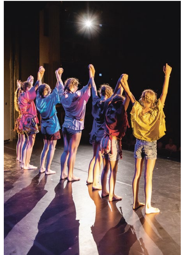
Ferienprogramm für Kinder

Kosten inkl. Theaterticket: 12,00€ p.P. (Ermäßigung mit ErlangenPass) Anmeldung an theaterpaedagogik@ stadt.erlangen.de Anmeldeschluss: 20.03.